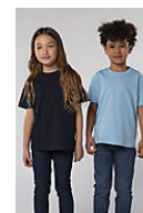
SOL'S Imperial KIDS 11770