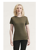
SOL'S REGENT WOMEN 01825