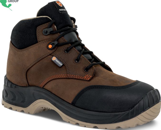
■ 3833 COGNAC | 36 ▶ 51